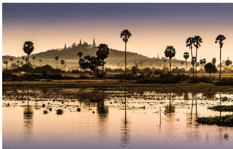
ภาพประกอบ 2 เมืองอุดงจัตมีชัยเริ่มต้นของพระพุทธศาสนานิกายธรรมยุติกนิกายในกัมพูชา