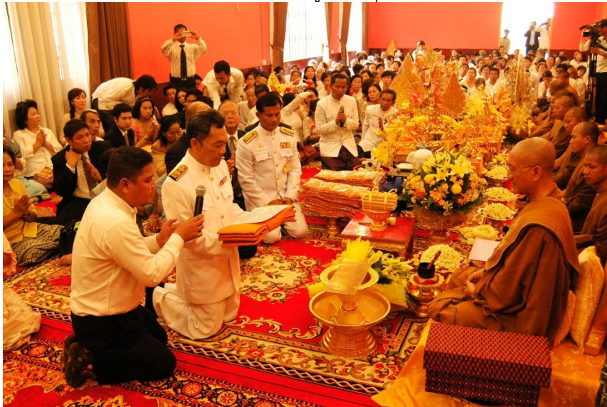
ภาพประกอบ 4 สมเด็จพระสังฆราชสุคนธาธิปติ (บัว คลี)

พระราชโอรสของสมเด็จพระสีหนุ เป็นหัวหน้าพรรค และอีกกรณีหนึ่งเป็นที่รู้จักในระดับหนึ่งว่าคณะสงฆ์ธรรมยุติ เป็นฐานทางการเมืองให้แก่พรรคพุนซินเปค และคณะสงฆ์ที่บวชก่อนปี 1989/2532 ฝ่ายมหานิกายส่วนใหญ่เป็นฐานของการเมืองให้แก่พรรคประชาชนกัมพูชาที่มีฮุน เซน เป็นหัวหน้าพรรค เป็นต้น