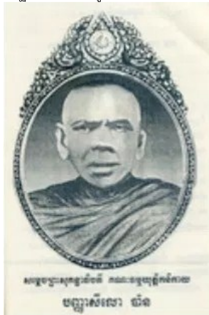
สมเด็จพระสังฆราชเจ้า กรมหลวงชินวราลงคฺญ์