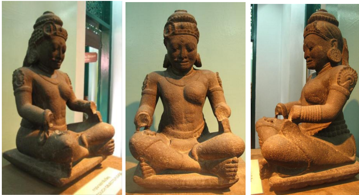
รูปที่ 2 เทวรูปพระอรรชนารีสวรร (ภาคผสมของพระศิวะและพระอูมา) จัดแสดงที่พิพิธภัณฑสถานแห่งชาติอุบลราชธานี อายูราว พุทธศตวรรษที่ 13-15 พบที่จังหวัดอุบลราชธานี (59 cm.)

ประติมากรรมรูปพระอรรชนารีสวรรถือเป็นประติมากรรมชิ้นเด่นที่พบเพียงสององค์ในประเทศไทย 4 และมีลักษณะทางประติมานวิทยาแบบพิเศษ คือ ประทับนั่งขัดพระขงฆ์ โดยใช้เพียงพระบาทไขว้กันอย่างเรียบง่าย แม้ว่าพระหัตถ์ทั้งสองข้างจะหักหายไป แต่จากชิ้นส่วนที่เหลือของพระกรทำให้สันนิษฐานได้ว่า ในพระหัตถ์ซึ่งคือพระศิวะ ทรงคล้องสายลูกประคำ (อักษะมาลา) ในขณะที่พระกรซ้าย ส่วนที่เป็นพระอูมา ทรงประดับพระกรด้วยกำไลลักษณะคล้ายห่วงโลหะ พระกรทั้งสองอาจจะเคยวางอยู่บนพระขงฆ์ ตามลักษณะการนั่งของนักบวช