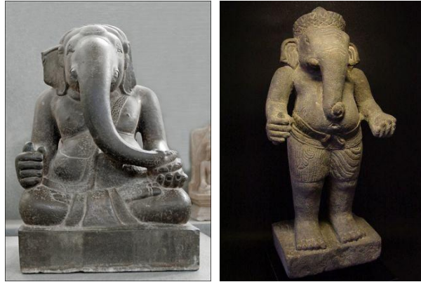
รูปที่ 8 ตัวอย่างประติมากรรมพระเศวตเศียรสี่พระเศียร (ซ้าย) จาก พิพิธภัณฑสถานแห่งชาติเมืองคานัง และพระเศวตเศียรสี่พระเศียรแบบนครวัด จาก พิพิธภัณฑสถานแห่งชาติส่วนบุคลล (ขวา) ประติมากรรมทั้งหมดอายุราวพุทธศตวรรษที่ 15-17

นอกจากประติมากรรมพระเศวตเศียรแล้ว ในจังหวัดอุบลราชธานี ก็ยังพบว่ามีกรนับถือเทพเจ้าชั้นรองซึ่งเป็นเทพประจำทิศ และ เทพนพเคราะห์ ในชุมชนโบราณสมัยได้รับอิทธิพลเขมรอีกด้วย ซึ่งประติมากรรมเหล่านี้ สร้างในรูปของแผ่นสลักรูปเทพเจ้าเก้าพระองค์เพื่อประดับในศาสนาสถาน ดังที่ปรากฏในศิลปะเขมรสมัยเมืองพระนคร แสดงให้เห็นถึงอิทธิพลทางศาสนา และ ศิลปกรรมจากอาณาจักรเขมรที่เผยแพร่เข้ามาในภาคอีสานตอนล่างซึ่งได้รับความนิยมจากชุมชนในท้องถิ่นเป็นอย่างมาก