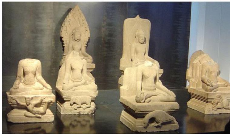
รูปที่ 10 รูปเทพผู้รักษาทิศในศิลปะจามปา พร้อมพาหนะ อายุราวพุทธศตวรรษที่ 15-16 (พิพิธภัณฑ์เกมีต์ ปารีส)

การนับถือเทพนพเคราะห์ในดินแดนแถบลุ่มแม่น้ำโขงเป็นไปอย่างแพร่หลาย ในศิลปะจามก็ยังคงปรากฏการนับถือเทพนพเคราะห์และเทพประจำทิศ แม้ว่าจะไม่ได้อยู่ในรูปเทพเจ้าเก้าองค์ดังที่ปรากฏในศิลปะเขมร ส่วนใหญ่เทพเจ้าเหล่านี้มักจะสร้างเป็นรูปเคารพเดี่ยวๆ หรือ สลักเป็นภาพเดี่ยวตามทิศของศาสนสถาน ที่ปราสาทบ้านเบญจ จังหวัดอุบลราชธานี ก็มีการค้นพบแผ่นสลักรูปเทพเจ้าเก้าองค์ อายุราวพุทธศตวรรษที่ 16-17 ในรูปแบบของศิลปะเขมรแบบนครวัด เทพทั้งเก้าองค์ได้ถูกสลักพร้อมพาหนะ เป็นเทพนพเคราะห์สี่องค์ คือ พระอาทิตย์ พระจันทร์ พระราหูและ พระเกตุ ประกอบด้วยเทพประจำทิศคือ พระอินทร์ พระกুবเระ พระขม พระวรุณ และ พระอัคนี ตามคตินิยมของการสลักแผ่นภาพในศิลปะเขมรสมัยนครวัด จึงสันนิษฐานได้ว่าการนับถือเทพเจ้าชั้นรอง หรือ เทพเจ้าประจำทิศและเทพนพเคราะห์ในประเทศไทย ได้รับอิทธิพลโดยตรงจากศาสนาพราหมณ์ในอาณาจักรเขมร