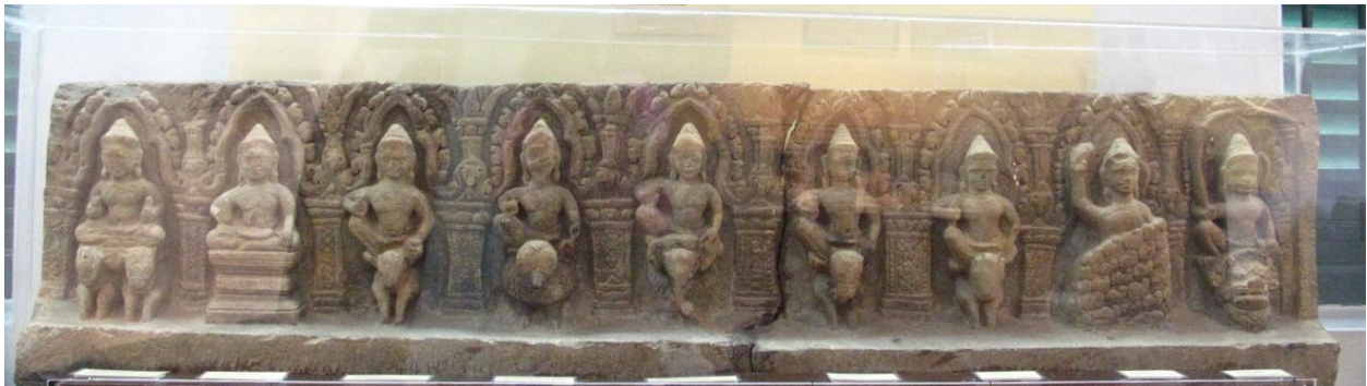
รูปที่ 9 แผ่นสลักรูปเทพเจ้าเก้าองค์ศิลปะเขมรแบบนครวัด อายุราวพุทธศตวรรษที่ 16-17 พบที่ปราสาทบ้านเบญจ จังหวัดอุบลราชธานี ปัจจุบันจัดแสดงที่พิพิธภัณฑสถานแห่งชาติอุบลราชธานี

นอกจากประติมากรรมพระเศวตเศียรแล้ว ในจังหวัดอุบลราชธานี ก็ยังพบว่ามีกรนับถือเทพเจ้าชั้นรองซึ่งเป็นเทพประจำทิศ และ เทพนพเคราะห์ ในชุมชนโบราณสมัยได้รับอิทธิพลเขมรอีกด้วย ซึ่งประติมากรรมเหล่านี้ สร้างในรูปของแผ่นสลักรูปเทพเจ้าเก้าพระองค์เพื่อประดับในศาสนาสถาน ดังที่ปรากฏในศิลปะเขมรสมัยเมืองพระนคร แสดงให้เห็นถึงอิทธิพลทางศาสนา และ ศิลปกรรมจากอาณาจักรเขมรที่เผยแพร่เข้ามาในภาคอีสานตอนล่างซึ่งได้รับความนิยมจากชุมชนในท้องถิ่นเป็นอย่างมาก