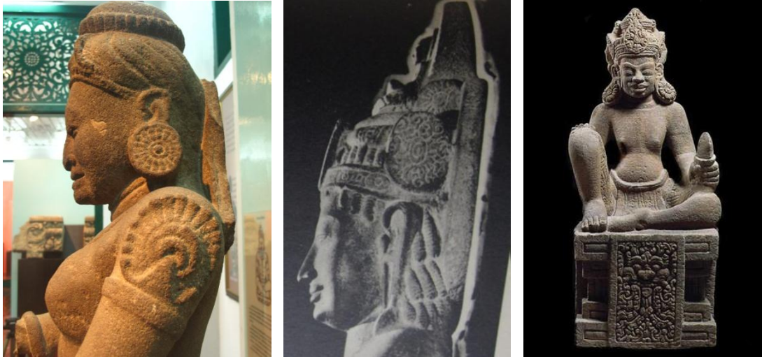
รูปที่ 4.1 (จากซ้าย) พระอรรณนาวิศวรรจากอุบลราชธานี (กลาง) พระโพธิสัตว์ศิลปะเขมรก่อนเมืองพระนคร (กำแพงพระ) อายุราว พุทธศตวรรษที่ 14-15 จากราขเคียร์ ปัจจุบันจัดแสดงที่พิพิธภัณฑ์แห่งชาติเกิเมต์ และ ประติมากรรมพระศิวะ ศิลปะจามแบบดงเดื่อง อายุราวพุทธศตวรรษที่ 15 จัดแสดงที่พิพิธภัณฑ์แห่งชาติดานัง ประเทศเวียดนาม