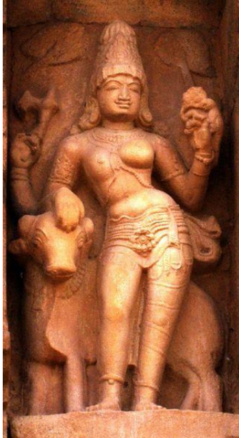
รูปที่ 3 พระอรรณาริศวร ในศิลปะอินเดียใต้ อายุราวพุทธศตวรรษที่ 16-17 ศิลปะแบบโจพะ (Chola) จากเมืองคังโคโกณฑะโจพะปุรัม (Gangaikonda Cholapuram)

ในพระหัตถ์ เช่น สายปะคำ (อักษะมาลา) หรือ งู นอกจากนี้ เครื่องทรงของพระศิวะก็ยังคงแสดงในรูปของอาภรณ์บุรุษ ต่างจาก ส่วนของพระเทวี ซึ่งแสดงการประดับด้วยเครื่องศிரากรณ์อย่างสตรี ในศิลปะอินเดีย พระอรรณาริศวร อาจมีทั้งประทับยืน และนั่ง มีจำนวนพระกรตั้งแต่ 2-4 กร