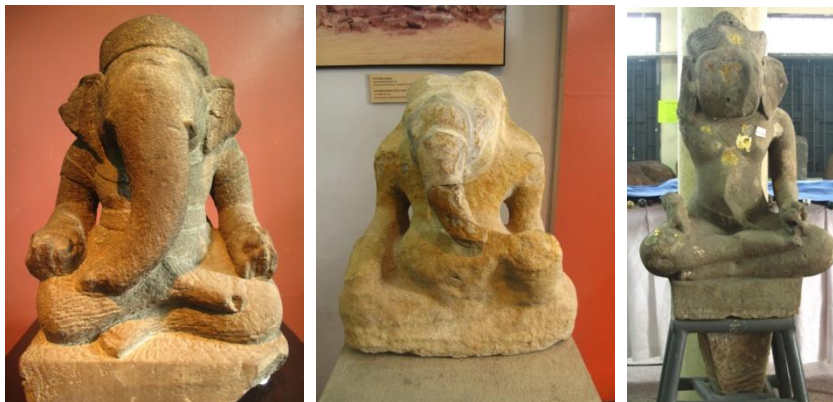
รูปที่ 7 ตัวอย่างประติมากรรมพระเคณศ ที่พบในจังหวัดอุบลราชธานี (ซ้าย และกลาง) พระเคณศจากบ้านบอน อำเภวารินทร์ชำราบ และพระเคณศไม่ทราบที่มาจากวัดสุปฏิหาราม จังหวัดอุบลราชธานี ประติมากรรมทั้งหมดอายุราวพุทธศตวรรษที่ 16-17

ลักษณะทางประติมานวิทยาของพระเคณศ ศิลปะเขมรที่พบในจังหวัดอุบลราชธานีนั้น มีลักษณะที่เหมือนกันกับพระเคณศศิลปะเขมรที่พบในประเทศกัมพูชา (Bhattacharya 1961) แต่กระนั้นก็ยังมีความแตกต่างเล็กน้อยในด้านรายละเอียดของเครื่องประดับ ผ้าทรง และ ลักษณะทางประติมานวิทยาบางประการ ซึ่งอาจกล่าวได้ว่าเป็นเพราะความแตกต่างด้านฝีมือของช่าง และความเชี่ยวชาญทางด้านการสร้างสรรคงานประติมากรรมทางศาสนา โดยมีตัวอย่างจากพระเคณศที่พบที่บ้านบอน อำเภวารินทร์ชำราบ (รูปที่ 7 ซ้าย) แม้ว่าเทวรูปของพระเคณศจะสร้างตามแบบศิลปะเขมรแทบทุกประการ แต่ การทิ้งวงของพระองค์ได้บิดไปทางขวา ในพระหัตถ์ที่ทรงถือขนมโมทกะ ( Modaka ) ซึ่งต่างจากพระเคณศในศิลปะเขมร จามปา และ อินเดียทั่วไปที่ทิ้งวงไปด้านขวา