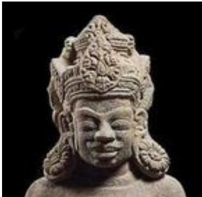
รูปที่ 4.2 ภาพขยายส่วนศีรษะของประติมากรรมนุรูปศิลปะจามแบบดงเดื่อง