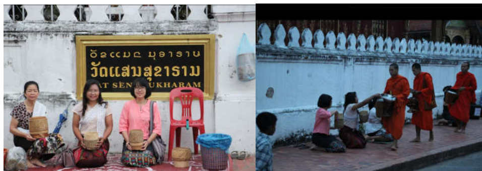
ภาพที่ 7 กิจกรรมใส่บาตรพระร้อย ที่หลวงพระบาง กิจกรรมเชิงวัฒนธรรมสาธิตสำหรับ นักท่องเที่ยว แต่เท่าที่สังเกตและเก็บข้อมูล เพราะเหล่านี้ส่วนใหญ่เป็นนักเรียน นักศึกษาที่วัดภูควาย

ข้อมูลอีกส่วนหนึ่งที่ได้จากการลงพื้นที่ของชววรรณ หนูแก้ว (2561) ให้ข้อมูลเสริมว่า