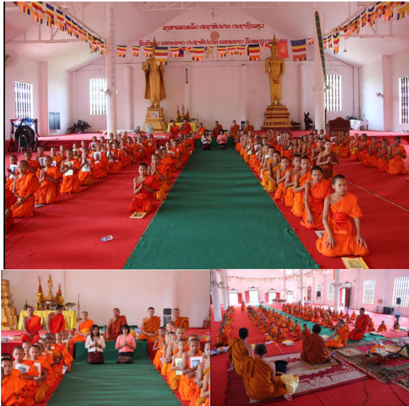
ภาพที่ 6 สังเกตการณ์ และพบผู้บริหารและนักเรียนการศึกษาสงฆ์ของลาวที่หลวงพระบาง วัดภูควาย (ที่มา: ผู้เขียน, 15 กรกฎาคม 2561)