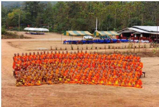
ภาพที่ 12 พระหนุ่มสามเณรน้อย โนนามนักเรียนโรงเรียนมัธยมสงฆ์ วัดภูควาย

“...โรงเรียนแห่งนี้สอนระดับมัธยมตอนต้น ม.1 – ม. 4 ที่นี้มีครูอยู่ 11 ท่าน เป็นทั้งฆราวาส และพระสงฆ์ และมีนักเรียนสามเณรประมาณ 90 รูป ถือว่าเป็นโรงเรียนสงฆ์ขนาดเล็กในเมืองแก่นท้าว โรงเรียนยังขาดแคลนอุปกรณ์การเรียน สภาพโรงเรียนเป็นตึกหลังเดียว สองชั้น ปรับปรุงจากกุฏิสงฆ์มาเป็นโรงเรียน จากการสังเกตห้องเรียนชั้นล่างของชั้น ม. 3 เป็นพื้นที่เก็บของที่ใช้เป็นห้องเรียน การสอนของครูฆราวาสผู้สอนใช้การบรรยายให้นักเรียนสามเณรจดตามที่ตนสอน โรงเรียนสงฆ์แห่งนี้เป็นโรงเรียนอยู่ภายใต้การดูแลของกระทรวงศึกษาธิการ เป็นหลักสูตรโรงเรียนปริยัติธรรมสามัญ คือ การผสมผสานทั้งเรียนธรรมและเรียนฝ่ายสามัญด้วย จบการศึกษาออกมาสามารถไปเรียนต่อยังสถาบันที่สูงขึ้นทุกแห่งเหมือนการศึกษาของรัฐอื่นทั่วไป ส่วนใหญ่ของสามเณรมาจากชนบทห่างไกลมาอาศัยตามวัดต่างๆในเมืองแก่นท้าวไม่ได้ประจำอยู่วัดนี้แห่งเดียว เณรจะกระจายตามวัดต่างๆ เพราะวัดที่มีโรงเรียนไม่สามารถรองรับจำนวนสามเณรได้ทั้งหมด”