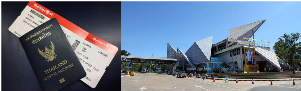
ภาพที่ 2 เอกสารใช้สำหรับการเดินทางกรุงเทพฯ-อุบลราชธานี-ด่านช่องเม็ก-ปากเซ (จำปาสัก) กับกิจกรรมการ เรียนรู้จากพื้นที่วิทยาลัยสงฆ์จำปาสัก ที่วัดหลวงปากเซ และปราสาทวัดภู

ความพร้อมก่อนเดินทาง เมื่อเสร็จเรียบร้อย คณะพวกเราเกือบ 20 รูป/คน จึงเดินทางต่อโดยรถตู้จากวิทยาเขต อุบลราชธานี พร้อมคณะไปชายแดนเพื่อผ่านจุดผ่านแดน ผ่านอำเภอสิรินธร วิ่งผ่านสันเขื่อนสิรินธร ไปจนถึงช่องเม็ก อันเป็นจุดผ่านแดนทางบกระหว่างไทยและลาว รวมระยะทางจาก มจร วิทยาเขตอุบลราชธานี ไปถึงชายแดนราว ประมาณ 80 กิโลเมตร โดยประมาณ จากนั้นได้นั่งรถผ่านเข้าไปยังฝั่งลาว วิ่งไปตามถนน 16W ผ่านบ้านนาเวียง บ้าน โพนทอง และปากเซระยะทางจากชายแดนราวประมาณ 50 กิโลเมตร นั่งรถจากชายแดนผ่านทุ่งนาป่าข้าวยามนี้ ใน บรรยากาศของการเดินทางแบบบ้านป่านาข้าว ที่บรรยากาศสองฟากทางเต็มไปด้วยนาข้าว และฝนปรอยประคบ ภาพข่าว “โพดุล” ถล่มยับ เหนือ-อีสานอ่วม” (ไทยรัฐ: 31 สิงหาคม 2561) เมื่อจำเพาะไปที่จังหวัดอุบลราชธานี สถานการณ์น้ำท่วมพร้อมภาพข่าวที่ว่า “แตกแล้ว! อ่างเก็บน้ำห้วยจระแม จ.อุบลฯ เจอฤทธิ์โพดุลถล่ม” (ผู้จัดการ ออนไลน์: 30 สิงหาคม 2562 ) ดังนั้น สถานการณ์ของการเดินทางตลอด 2-3 วัน เป็นบรรยากาศที่ฉ่ำเย็น ฝนตก ตลอดการเดินทาง จึงทำให้รู้สึกอย่างนั้นเพราะฝนไม่เปิดโอกาสให้ลงไปถ่ายรูปที่ใดได้เลย แม้ในขณะที่ลงมือบันทึก เกี่ยวกับการเดินทางในจำปาสัก ก็มีข้อมูลว่าน้ำท่วมจำปาสัก “วิกฤติหนัก! น้ำท่วมวัดใน ‘ปากเซ’ สปป.ลาว พระสงฆ์ ต้องเดินลุยน้ำ” (แนวหน้า ออนไลน์: 4 กันยายน 2562) และบางพื้นที่ในจังหวัดอุบลราชธานี ก็ขอสงวนใจกำลังใจพื่อน้องผู้ประสบภัยเกี่ยวกับน้ำท่วมภายใต้กระแสพายุ ที่พัดผ่านไทยลาวในช่วงนี้ผ่านไปด้วยดี ดังนั้น จากประสบการณ์ ของการเดินทางกรุงเทพฯ-อุบลราชธานี-จำปาสัก บรรยากาศหน้าฝน สู่ น้ำท่วม ผู้เขียนจะได้บันทึกเรื่องเล่าแบ่งปันกัน เป็นลำดับไป