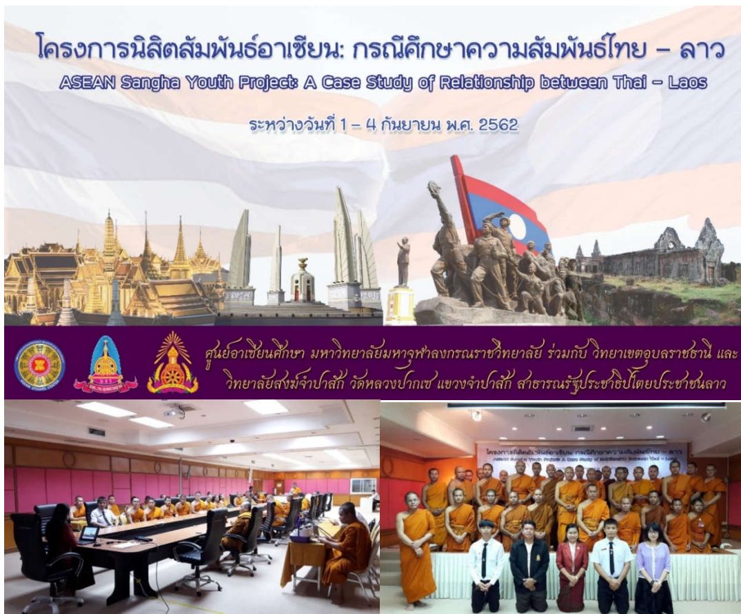
ภาพที่ 1 กิจกรรมเตรียมความพร้อมศูนย์อาเซียนศึกษาร่วมกับ มจร วิทยาเขตอุบลราชธานี ก่อนนำนิสิตลงพื้นที่จริง เพื่อเรียนรู้ข้ามวัฒนธรรมอาเซียน ที่ปากเซ และวิทยาลัยสงฆ์จำปาสัก

บริหารทรัพยากรมนุษย์ ที่นัยหนึ่งเพื่อศึกษารูปแบบ ระบบ แนวทาง วิธีการจัดการศึกษา อีกนัยหนึ่งในฐานะที่ มหาวิทยาลัยมหาจุฬาลงกรณราชวิทยาลัย (มจร) เป็นสถาบันการศึกษาภายใต้คณะสงฆ์ และพระพุทธศาสนา ซึ่งมี นิสิตที่เป็นพระสงฆ์ สามเณรชาวลาวเข้ามาศึกษาในมหาวิทยาลัย จากข้อมูลสถิติพระสงฆ์ลาวที่มาศึกษาใน มจร ทั่วประเทศรวมแล้วไม่น้อยกว่า 250 รูป ในปีการศึกษา 2562 และรวมไม่น้อยกว่า 3,500 รูป ในรอบ 10 ปีที่ผ่านมา ซึ่ง นัยหนึ่งอาจเป็นเครือข่ายร่วมกันระหว่างมหาวิทยาลัย ในการพัฒนาทรัพยากรมนุษย์ร่วมกันได้ จึงเก็บข้อมูลมาเล่า เพื่อประโยชน์ต่อการพัฒนาการศึกษาาร่วมกันและเป็นการแบ่งปันข้อมูลจากการเดินทางในประเทศลาวที่เมืองจำปาสัก ปากเซ ในครั้งนี้ด้วย