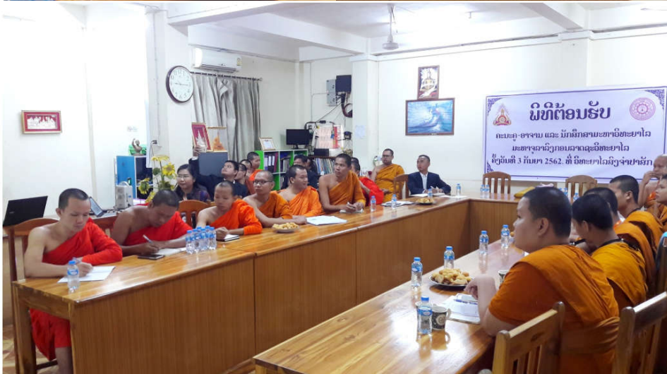
ภาพที่ 8 แลกเปลี่ยนเรียนรู้ ร่วมกับผู้บริหาร นิสิตวิทยาลัยสงฆ์ปากเซ ณ อาคารวิทยาลัยสงฆ์ วัดหลวงปากเซ จำปาสัก