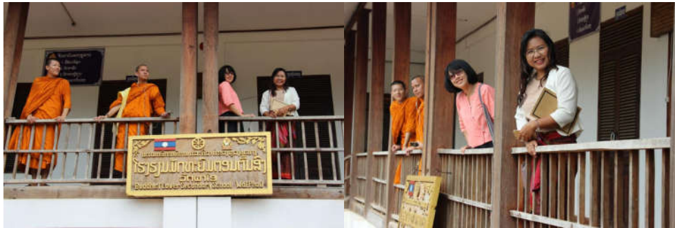
ภาพที่ 5 สังเกตการณ์ และพบผู้บริหารและนักเรียนการศึกษาสงฆ์ของลาวที่หลวงพระบาง โรงเรียนมัธยมสงฆ์ วัดผาโอ

ศาสนา ภาพของสามเณรจำนวนมากได้ส่งเสริมให้ลาวเป็นเมืองพุทธศาสนาที่มีเสน่ห์น่าค้นหา และเดินทางมาท่องเที่ยวของคนทั่วโลก ยังผลให้รัฐบาลลาวได้ให้ความสำคัญต่อการจัดระเบียบสงฆ์ให้ผิดชอบต่อพระศาสนาและประเทศชาติของตนด้วย...” (ธวัชวรรค์ หนูแก้ว, 2561)