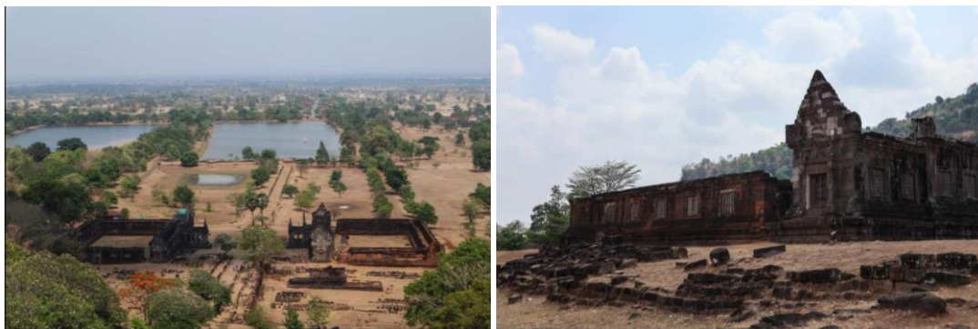
ภาพที่ 12 ปราสาทวัดภู เทวสถานของอารยธรรม “ขอม” โบราณ ในดินแดนจำปาสัก ในวันเดินทางฝนตก จึงได้แต่แบ่งปันภาพจากกัลยาณมิตร ที่เคยร่วมเดินทางกับศูนย์อาเซียน และเคยเดินทางมาแล้วมาแบ่งปัน เพื่อให้ครอบคลุมการเล่าเรื่องในจำปาสักด้วย

การเดินทางในจำปาสักครั้งนี้ เป็นการเดินทางที่เต็มไปด้วย “อุปสรรค” เนื่องด้วยฝน เพราะสถานการณ์ในประเทศไทย น้ำท่วม จังหวัดอุบลราชธานี น้ำขึ้นสูงเรื่อยๆ ฝนตกพรำตลอดทั้งวัน ลงเที่ยวค่อนข้างยาก กับจุดสำคัญ เช่น วัดเจ้าบุญอุ้ม ณ จำปาสัก ที่ตั้งตระหง่าน จึงได้แต่หาภาพทางออนไลน์ มาประกอบเพื่อประโยชน์การเดินทาง น้ำท่วมตลาดดาวเรือง เพราะฝนตก ปราสาทวัดภูที่เป็นจุดสำคัญของการศึกษาทางประวัติศาสตร์และโบราณคดี ด้วยถนนหนทางไม่เอื้อต่อการเดินทาง ทุกอย่างเป็นเงื่อนไข แต่อย่างน้อยก็ได้ประสบการณ์และเห็นว่าในสถานการณ์ของฝน ทำให้พวกเราต้องตระหนักเรื่องความปลอดภัย การศึกษาแลกเปลี่ยนสิ้นสุดไปพร้อมกับความชุ่มเย็นในจำปาสัก และภาพข่าวเกี่ยวกับสถานการณ์น้ำท่วมในประเทศไทย ในหลายจุด ๆ จึงหยิบมาบันทึกเป็นเรื่องเล่าตามสถานการณ์ของช่วงเวลา จึงได้แต่กล่าวว่า “สบายดีจำปาสัก” ก่อนการเดินทางกลับ