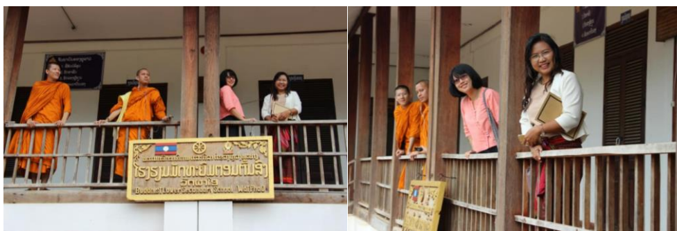
ภาพที่ 5 สังเกตการณ์ และพบผู้บริหารและนักเรียนการศึกษาสงฆ์ของลาวที่หลวงพระบาง โรงเรียนมัธยมสงฆ์ วัดผาโอ

“...รูปแบบชีวิตนักรบในพุทธศาสนาของลาว เป็นเส้นทางแห่งการเริ่มต้นศึกษาของเด็กยากจนอยู่ห่างไกลเมืองและไร้โอกาสทางการศึกษา โดยมีโรงเรียนสงฆ์ประจำเมืองให้การศึกษาทิ้งทางโลกและทางธรรมกับเด็กเหล่านี้ การให้โอกาสจากโรงเรียนสงฆ์เป็นการลดค่าใช้จ่ายและให้ที่พักอาศัย ได้สร้างบุคลากรที่มีคุณภาพ มีความอดทนให้กับสังคมลาว สามเณรนอกจากจะอดทนในฐานะนักรบแล้ว ยังเป็นกลุ่มที่สร้างภาพลักษณ์ที่ดีให้กับพุทธศาสนา และนับเป็นเอกลักษณ์ทางวัฒนธรรมให้กับเมืองสำคัญ เช่น เมืองหลวงพระบาง เมืองมรดกโลก ที่มีภาพลักษณ์แห่งเมืองพุทธศาสนา ภาพของสามเณรจำนวนมากได้ส่งเสริมให้ลาวเป็นเมืองพุทธศาสนาที่มีเสน่ห์น่าค้นหา และเดินทางมาท่องเที่ยวของคนทั่วโลก ยังผลให้รัฐบาลลาวได้ให้ความสำคัญต่อการจัดระเบียบสงฆ์ให้ผิดชอบต่อพระศาสนา และประเทศชาติของตนด้วย...” (ธวัชวรรค์ หนูแก้ว, 2561)