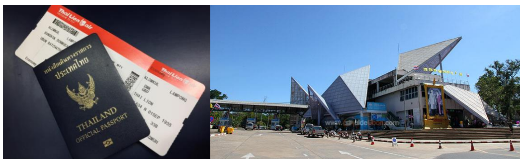
ภาพที่ 2 เอกสารใช้สำหรับการเดินทางกรุงเทพฯ-อุบลราชธานี-ด่านช่องเม็ก-ปากเซ (จำปาสัก) กับ กิจกรรมการเรียนรู้จากพื้นที่วิทยาลัยสงฆ์จำปาสัก ที่วัดหลวงปากเซ และปราสาทวัดภู

โพนทอง และปากเซระยะทางจากชายแดนราวประมาณ 50 กิโลเมตร นั่งรถจากชายแดนผ่านทุ่งนาป่าข้าว ยามนี้ ในบรรยากาศของการเดินทางแบบบ้านป่านาข้าว ที่บรรยากาศสองฟากทางเต็มไปด้วยนาข้าว และ ฝนปรอยประกอบภาพข่าว "โพดุล" ถล่มยับ เหนือ-อีสานอ่วม" (ไทยรัฐ: 31 สิงหาคม 2561) เมื่อจำเพาะ ไปที่จังหวัดอุบลราชธานีสถานการณ์น้ำท่วมพร้อมภาพข่าวที่ว่า "แตกแล้ว! อ่างเก็บน้ำห้วยจระแม จ.อุบลฯ เจอฤทธิ์โพดุลถล่ม" (ผู้จัดการออนไลน์: 30 สิงหาคม 2562) ดังนั้น สถานการณ์ของการเดินทางตลอด 2-3 วัน เป็นบรรยากาศที่ฉ่ำเย็น ฝนตกตลอดการเดินทาง จึงทำให้รู้สึกอย่างนั้นเพราะฝนไม่เปิดโอกาสให้ลงไป ถ่ายรูปที่ใดได้เลย แม้ในขณะที่ลงมือบันทึกเกี่ยวกับการเดินทางในจำปาสัก ก็มีข้อมูลว่าน้ำท่วมจำปาสัก "วิกฤติหนัก! น้ำท่วมวัดใน 'ปากเซ' สปป.ลาว พระสงฆ์ต้องเดินลุยน้ำ" (แนวหน้า ออนไลน์: 4 กันยายน 2562) และบางพื้นที่ในจังหวัดอุบลราชธานี ก็ขอส่งแรงใจกำลังใจพี่น้องผู้ประสบภัยเกี่ยวกับน้ำท่วมภายใต้ กระแสพายุ ที่พัดผ่านไทยลาวในช่วงนี้ผ่านไปด้วยดี ดังนั้น จากประสบการณ์ของการเดินทางกรุงเทพฯ-อุบลราชธานี-จำปาสัก บรรยากาศหน้าฝน สุนัขน้ำท่วม ผู้เขียนจะได้บันทึกเรื่องเล่าแบ่งปันกันเป็นลำดับไป