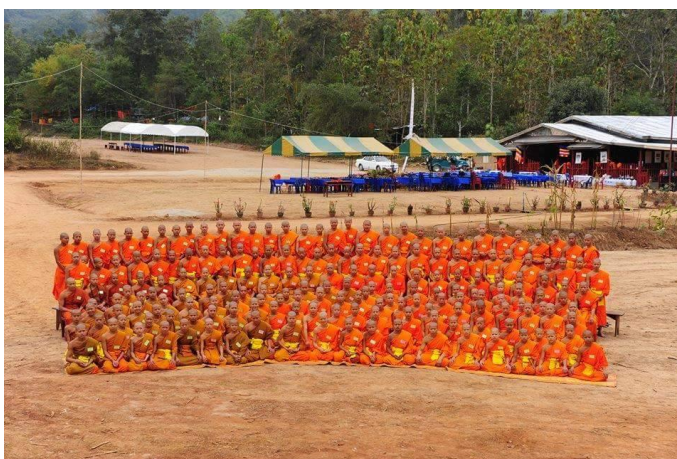
ภาพที่ 12 พระหนุ่มสามเณรน้อย ในนามนักเรียนโรงเรียนมัธยมสงฆ์ วัดกวนาย (ที่มา: ออนไลน์, 15 กรกฎาคม 2561)

“...โรงเรียนแห่งนี้สอนระดับมัธยมตอนต้น ม.1 – ม. 4 ที่มีครูอยู่ 11 ท่าน เป็นทั้งฆราวาสและพระสงฆ์ และมีนักเรียนสามเณรประมาณ 90 รูป ถือว่าเป็นโรงเรียนสงฆ์ขนาดเล็กในเมืองแก่นท้าว โรงเรียนยังขาดแคลนอุปกรณ์การเรียน สภาพโรงเรียนเป็นตึกหลังเดียว สองชั้น ปรับปรุงจากกุฏิสงฆ์มาเป็นโรงเรียน จากการสังเกตห้องเรียนชั้นล่างของชั้น ม. 3 เป็นพื้นที่เก็บของที่ใช้เป็นห้องเรียน การสอนของครูฆราวาสผู้สอนใช้การบรรยายให้นักเรียนสามเณรจดตามที่ตนสอน โรงเรียนสงฆ์แห่งนี้เป็นโรงเรียนอยู่ภายใต้การดูแลของกระทรวงศึกษาธิการ เป็นหลักสูตรโรงเรียนปริยัติธรรมสามัญ คือการผสมผสานทั้งเรียนธรรมและเรียนฝ่ายสามัญด้วย จบการศึกษาออกมาสามารถไปเรียนต่อยังสถาบันที่สูงขึ้นทุกแห่งเหมือนการศึกษาของรัฐอื่นทั่วไป ส่วนใหญ่ของสามเณรมาจากชนบทห่างไกลมาอาศัยตามวัดต่างๆในเมืองแก่นท้าวไม่ได้ประจำอยู่วัดนี้แห่งเดียว เณรจะกระจายตามวัดต่างๆ เพราะวัดที่มีโรงเรียนไม่สามารถรองรับจำนวนสามเณรได้ทั้งหมด”