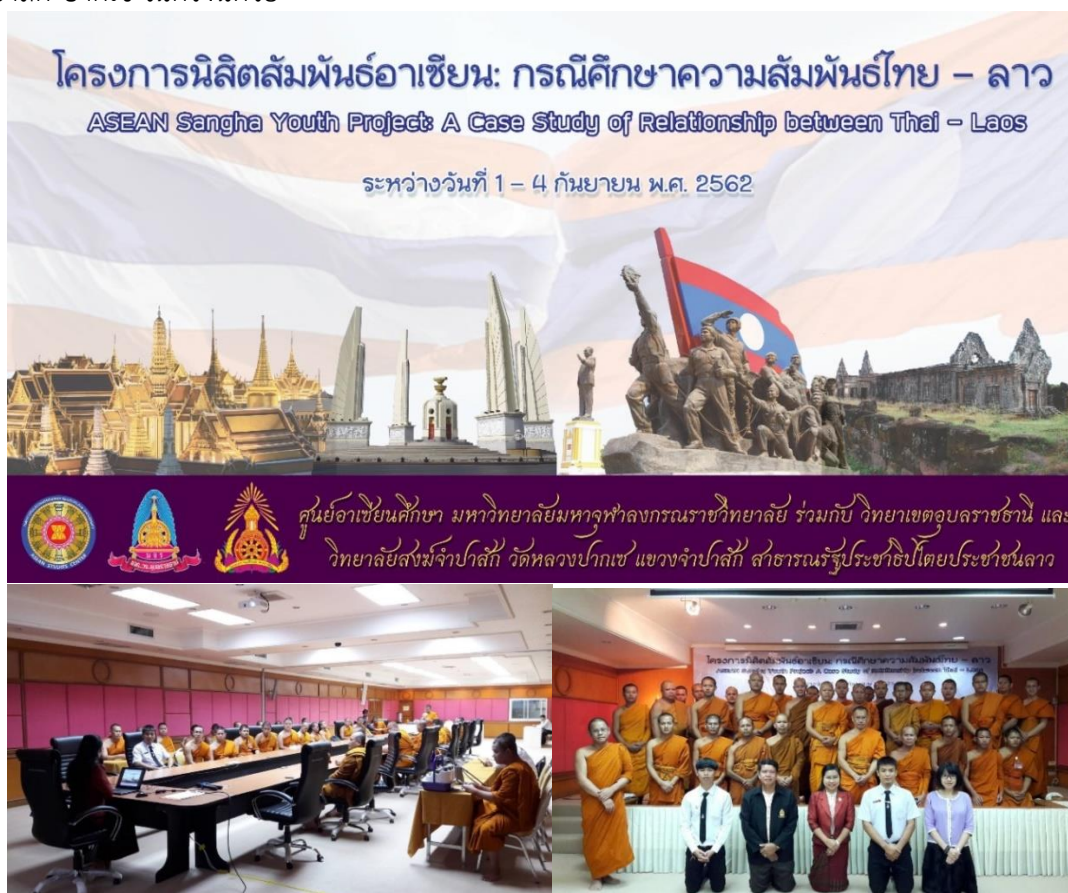
ภาพที่ 1 กิจกรรมเตรียมความพร้อมศูนย์อาเซียนศึกษาร่วมกับ มจร วิทยาเขตอุบลราชธานี ก่อนนำนิสิตลงพื้นที่จริงเพื่อเรียนรู้ข้ามวัฒนธรรมอาเซียน ที่ปากเซ และวิทยาลัยสงฆ์จำปาสัก (ที่มา: ศูนย์อาเซียนศึกษา, 2 กันยายน 2562)

เครือข่ายร่วมกันระหว่างมหาวิทยาลัย ในการพัฒนาทรัพยากรมนุษย์ร่วมกันได้ จึงเก็บข้อมูลมาแล้วเพื่อประโยชน์ต่อการพัฒนาการศึกษาร่วมกันและเป็นการแบ่งปันข้อมูลจากการเดินทางในประเทศลาวที่เมืองจำปาสัก ปากเซ ในครั้งนี้ด้วย