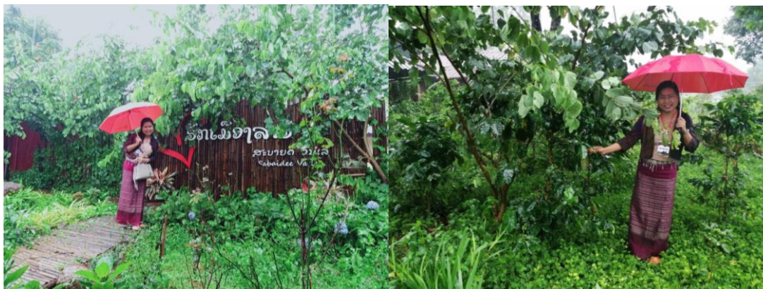
ภาพที่ 13 บรรยากาศในองค์กรรวมฝนตกเสียเป็นส่วนใหญ่ ร่มและละอองฝน จึงเป็นภาพประกอบของการเดินทางในช่วงกลางพรรษาของประเทศไทยลาว ในร่องมรสุมพายุ โทคูล สถานที่คือ Sabaidee Valley ไร่กาแฟคุณภาพของลาวจำปาสัก อันเป็นพื้นที่ปลูกกาแฟที่มาของกาแฟ “ดาว” ของลาว

การเดินทางในจำปาสักครั้งนี้ เป็นการเดินทางที่เต็มไปด้วย “อุปสรรค” เนื่องด้วยฝน เพราะสถานการณ์ในประเทศไทย น้ำท่วม จังหวัดอุบลราชธานี น้ำขึ้นสูงเรื่อยๆ ฝนตกพรำตลอดทั้งวัน ลงเที่ยวค่อนข้างยาก กับจุดสำคัญ เช่น วัดเจ้าบุญอุ้ม ณ จำปาสัก ที่ตั้งตระหง่าน จึงได้แต่หาภาพทางออนไลน์ มาประกอบเพื่อประโยชน์การเดินทาง น้ำท่วมตลาดดาวเรือง เพราะฝนตก ปราสาทวัดภูที่เป็นจุดสำคัญของการศึกษาทางประวัติศาสตร์และโบราณคดี ด้วยถนนหนทางไม่เอื้อต่อการเดินทาง ทุกอย่างเป็นเงื่อนไข แต่อย่างน้อยก็ได้ประสบการณ์และเห็นว่าในสถานการณ์ของฝน ทำให้พวกเราต้องตระหนักเรื่องความปลอดภัย การศึกษาแลกเปลี่ยนสิ้นสุดไปพร้อมกับความชุ่มเย็นในจำปาสัก และภาพข่าวเกี่ยวกับสถานการณ์น้ำท่วมในประเทศไทย ในหลายจุด ๆ จึงหยิบมาบันทึกเป็นเรื่องเล่าตามสถานการณ์ของช่วงเวลา จึงได้แต่กล่าวว่า “สบายดีจำปาสัก” ก่อนการเดินทางกลับ