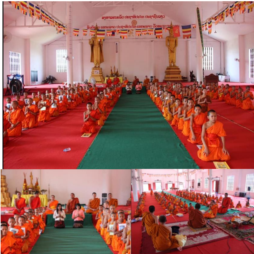
ภาพที่ 6 สังเกตการณ์ และพบผู้บริหารและนักเรียนการศึกษาสงฆ์ของลาวที่หลวงพระบาง วัตภูควาย (ที่มา: ผู้เขียน, 15 กรกฎาคม 2561)

ตัดวิชาบางวิชาของระบบโรงเรียนออก เช่น วิชาขับร้องและพลศึกษา หลักสูตรและชั้นปี เทียบเท่าระบบโรงเรียน เมื่อเรียนจบสามารถเข้าศึกษาต่อในสายอาชีพหรืออุดมศึกษา เช่นเดียวกับระบบโรงเรียน เด็กที่ขาดโอกาสทางการศึกษาจึงเดินทางเข้าเมือง เพื่อแสวงหาโอกาสทางการศึกษาจากระบบโรงเรียนในวัด ไม่ต้องมีค่าใช้จ่ายในเรื่องการกินอยู่เพราะอยู่อาศัยวัด และอาศัยอาหารจากญาติโยมที่มาบิณฑบาต ขณะเดียวกันก็ได้บวชเรียนใกล้ชิดเป็นอันหนึ่งอันเดียวกับพุทธศาสนาทำให้เยาวชนของชาติมีพื้นฐานที่ดีทางจิตใจ...”