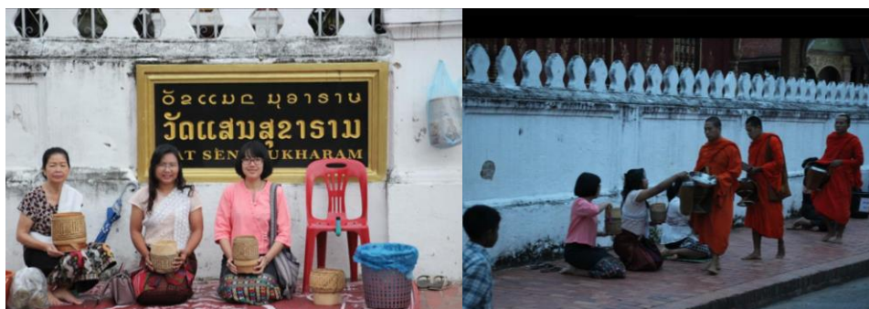
ภาพที่ 7 กิจกรรมใส่บาตรพระร้อย ที่หลวงพระบาง กิจกรรมเชิงวัฒนธรรมสาธิตสำหรับนักท่องเที่ยว แต่เท่าที่สังเกตและเก็บข้อมูล เพราะเหล่านี้นส่วนใหญ่เป็นนักเรียนนักศึกษาที่วัตภูควาย (ที่มา: ผู้เขียน, 15 กรกฎาคม 2561)