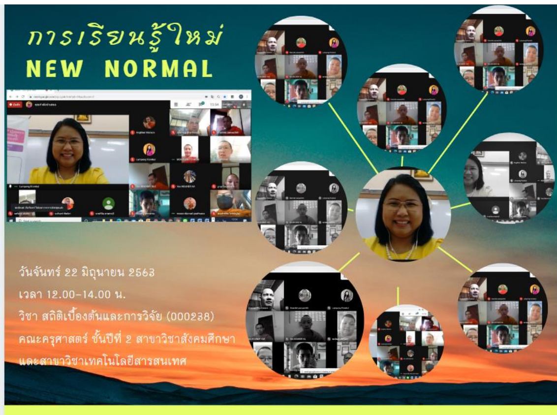
ภาพที่ 2 วิธี New Normal ที่การศึกษาไม่ได้อยู่ในชั้นเรียน โรงเรียน มหาวิทยาลัย แต่อยู่ทุกที่ ทุกเวลา ภายใต้เป้าหมายการเรียนเพื่อรู้ยังคงเดิมแต่วิธีการเปลี่ยนไป